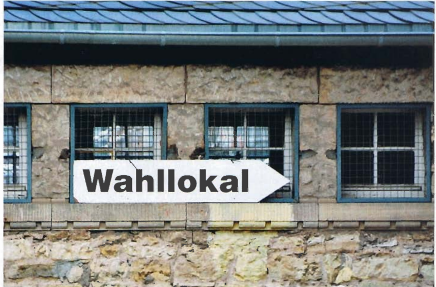
Am Wahltag, Punkt 18:00 Uhr. Da schließen die Wahllokale, da sind die Stimmen abgegeben, da endet die Demokratie.

Es wird und es muss sich – ALLES! – nicht ändern.